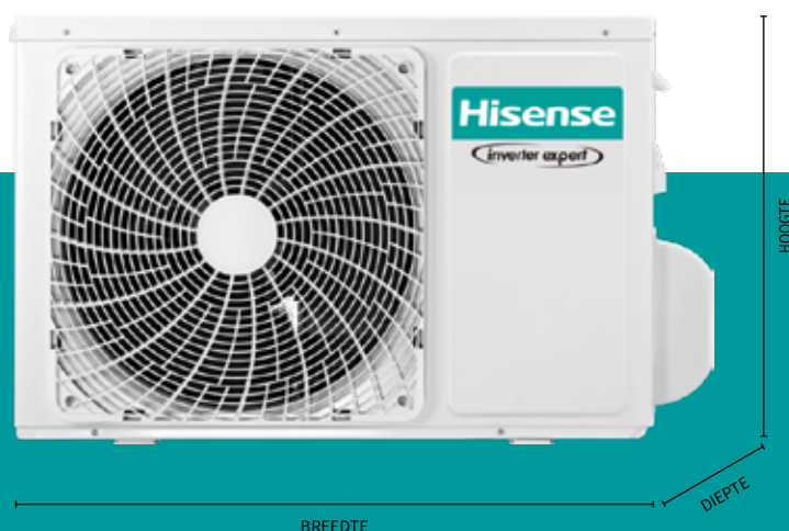
Buitenunit QF25XW00 / QF35XW00

Bij de ontwikkeling van de Hisense Fresh Master was, naast gezondheid, duurzaamheid een belangrijke factor. Door gebruik te maken van zogeheten 3D inverter technologie in combinatie met geoptimaliseerde luchtstromingen en geavanceerde warmtewisselaar, verbruikt de Fresh Master tot wel 30% minder energie ten opzichte van traditionele airconditioners. Het systeem is voorzien van een A+++ label op zowel koelen als verwarmen.